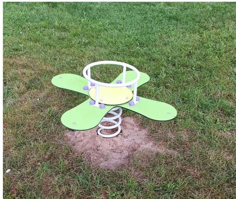
Bujak na placu zabaw