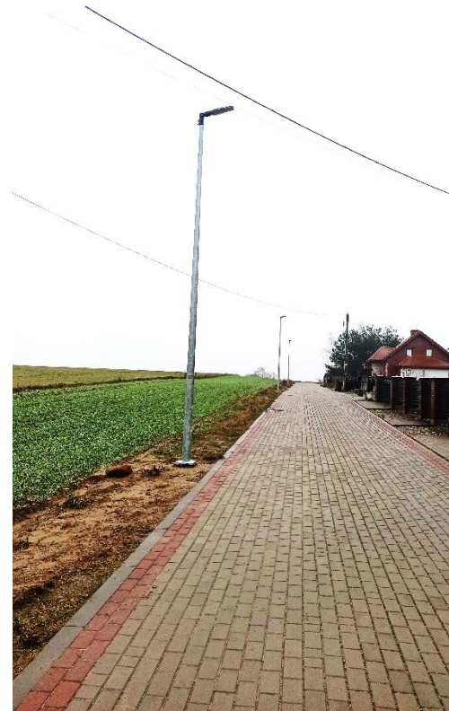
Rozbudowa oświetlenia ulicznego na ul. Lubawskiej