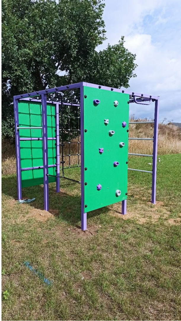
Urządzenie sprawnościowe na placu zabaw w Hartowcu