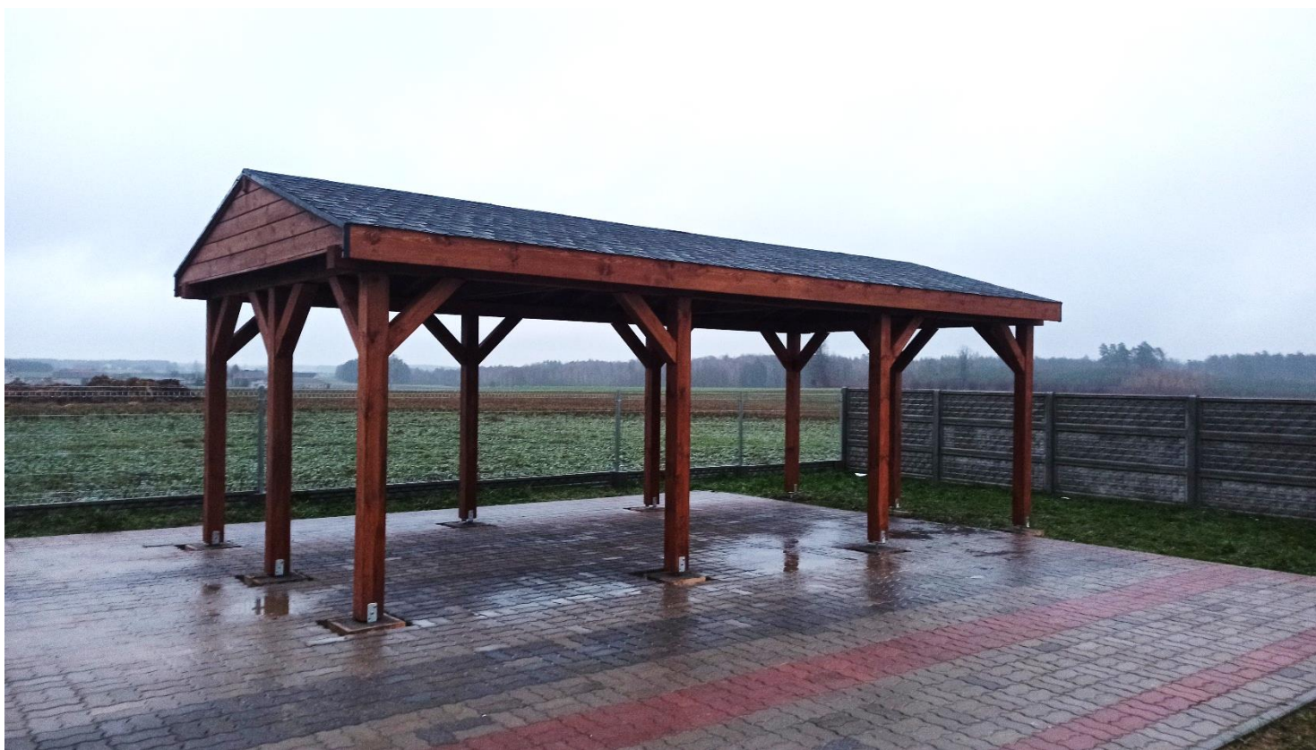
Altana w Gronowie