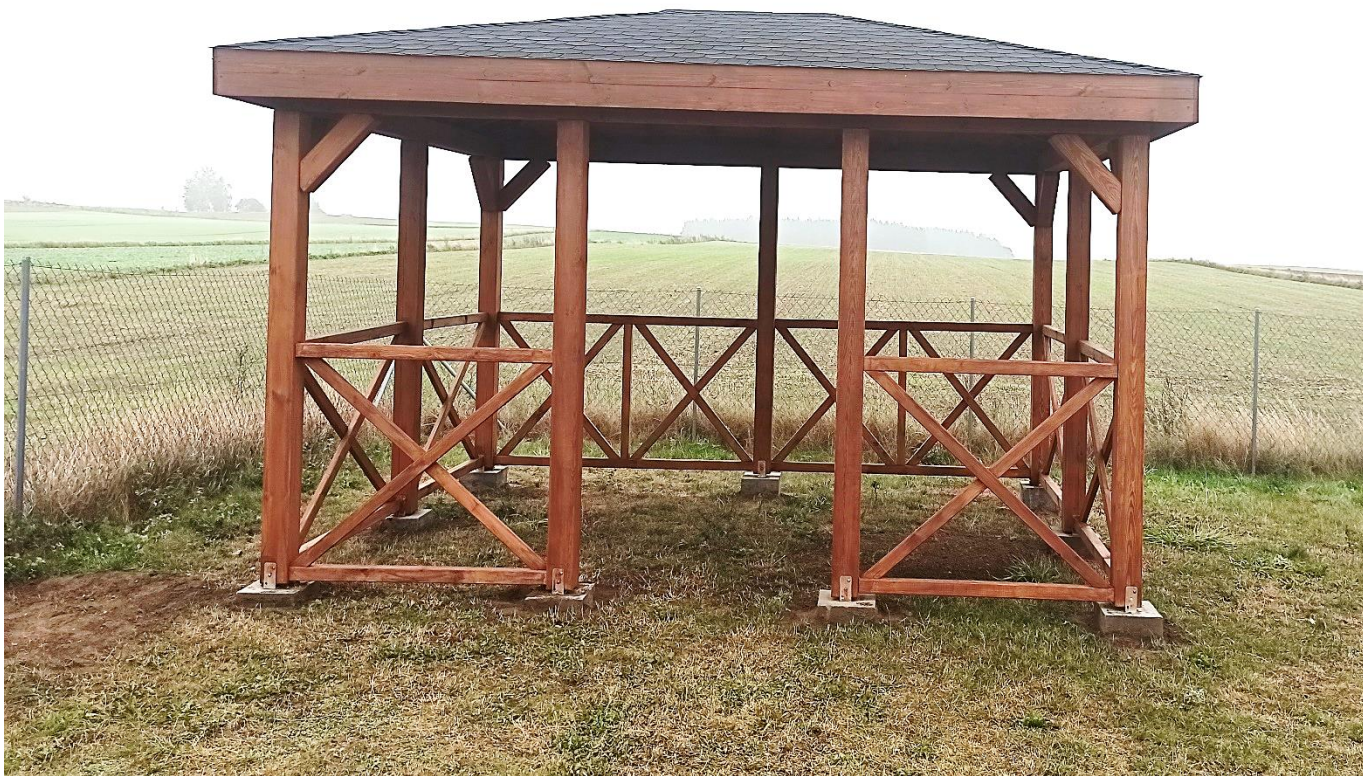
Altana w Truszczytach