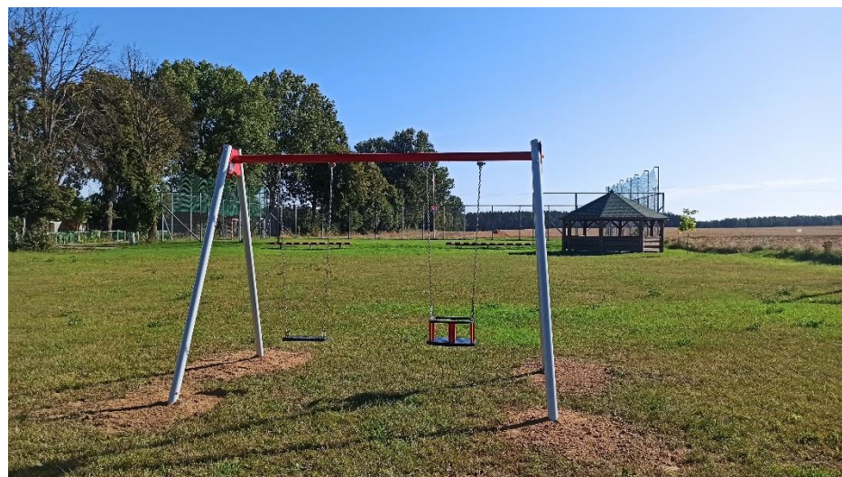
Zjeżdżalnia i huśtawka na placu zabaw w Dębieniu