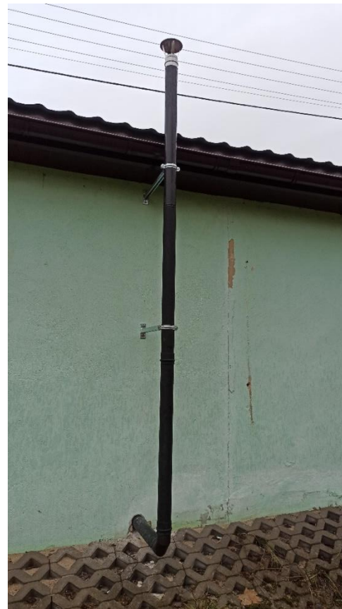
Rura spalinowa od pieca w świetlicy wiejskiej