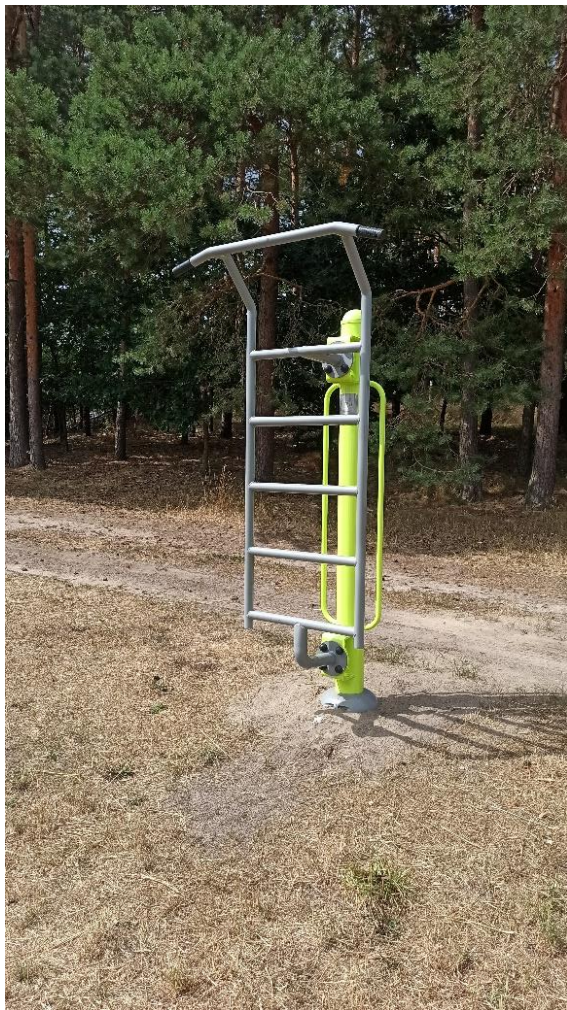
Drabinka- siłownia zewnętrzna