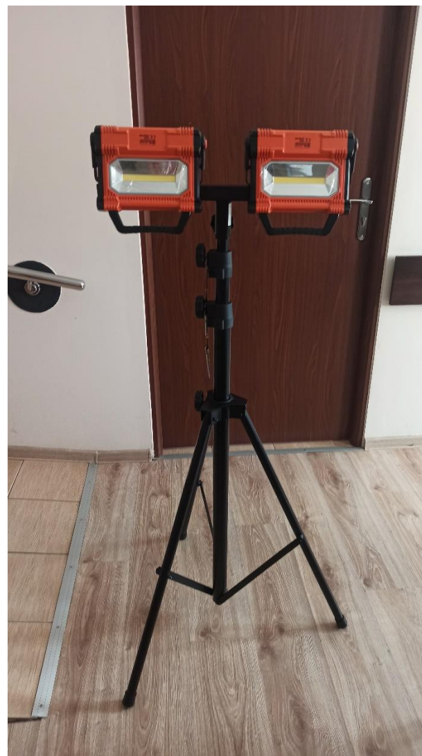
Maszt oświetleniowy dla OSP Jeglia