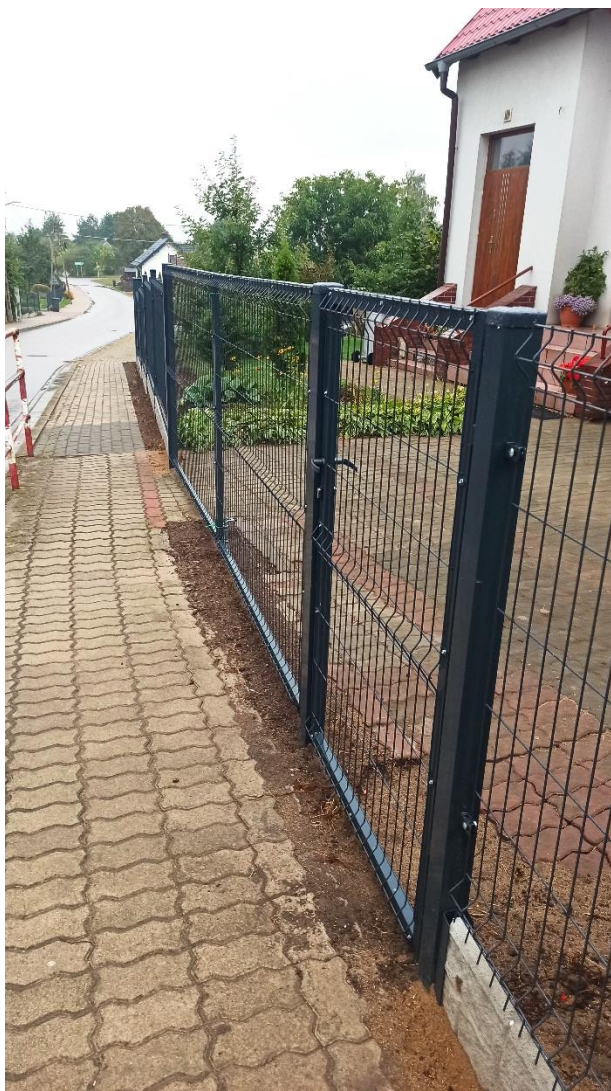
Nowe ogrodzenie przy świetlicy wiejskiej