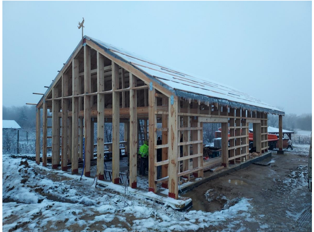
Budowa świetlicy wiejskiej w Koszelewkach