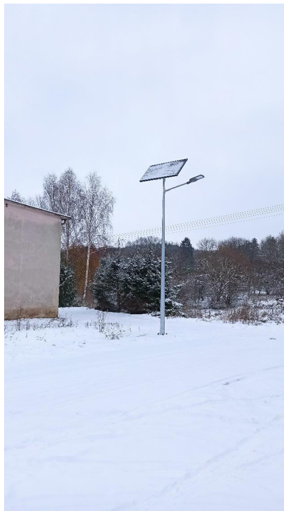
Lampa solarna w Szczuplinach