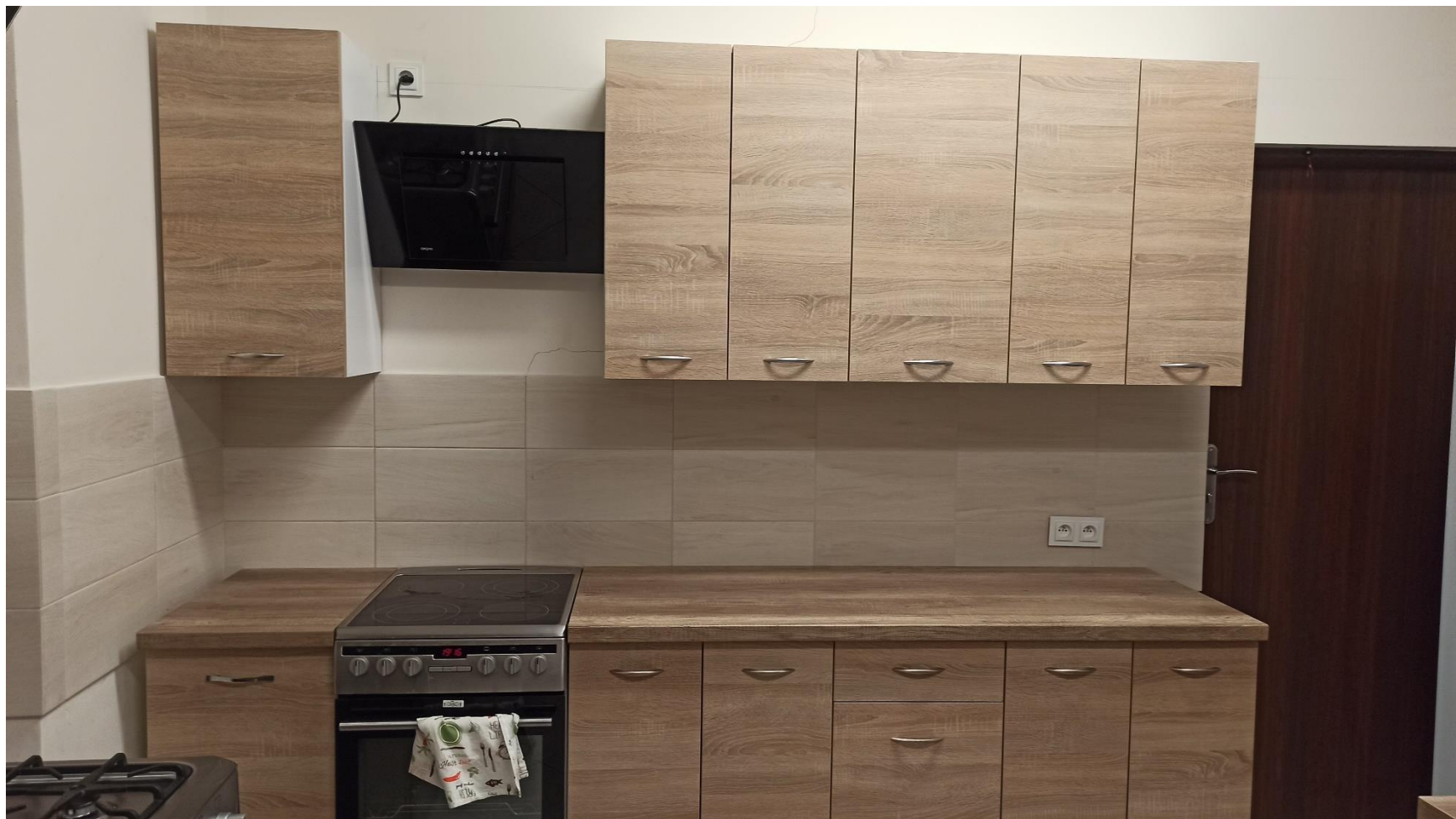
Meble kuchenne w świetlicy wiejskiej w Naguszewie