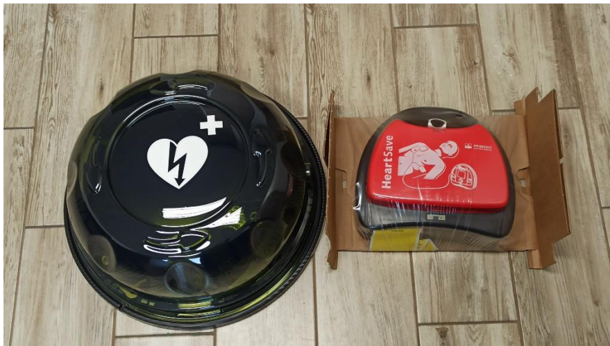
Defibrylator AED z kapsułą zewnętrzną