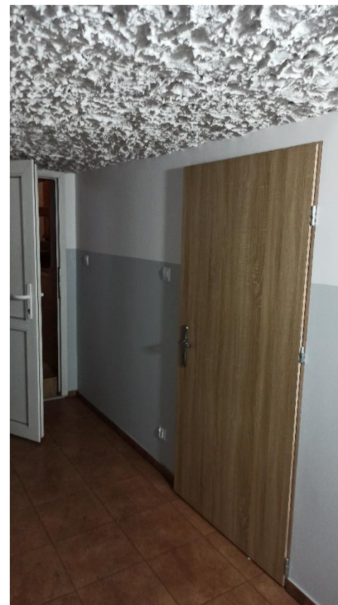
Modernizacja pomieszczenia piwnicznego w świetlicy wiejskiej