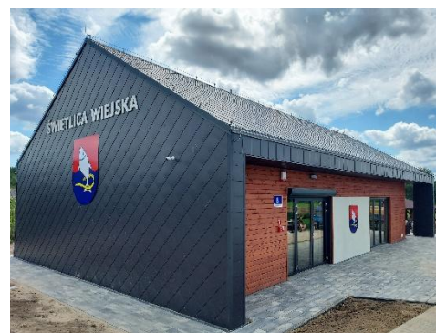
Budowa świetlicy wiejskiej w miejscowości Koszelewki wraz z infrastrukturą towarzyszącą.