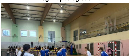
Bieg Niepodległości 2024