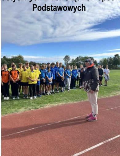
Mistrzostwa Gminy w Indywidualnych Zawodach Lekkoatletycznych Dziewcząt i Chłopców Szkół Podstawowych