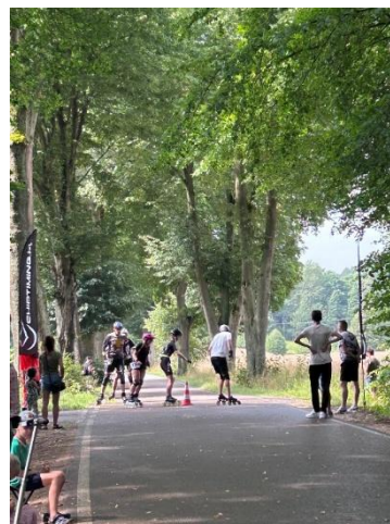
Półmaraton Rolkarski 2024