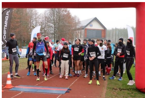
Bieg Niepodległości 2024 Olsztyn