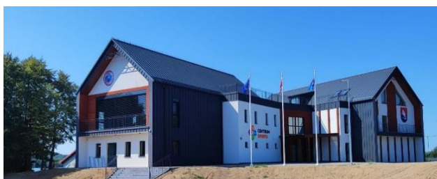
Budowa centrum sportowo-rekreacyjnego w Rybnie.

W 2024 roku Gmina Rybno zaciągnęła kredyt w wysokości 4 000 000 zł, który został przeznaczony na realizację ważnych inwestycji infrastrukturalnych – poprawiających jakość życia mieszkańców.