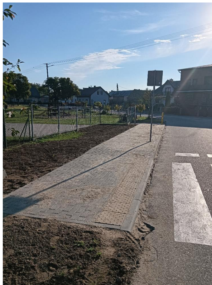
Wykonanie odcinka drogi z kostki brukowej oraz chodnika przy placu zabaw