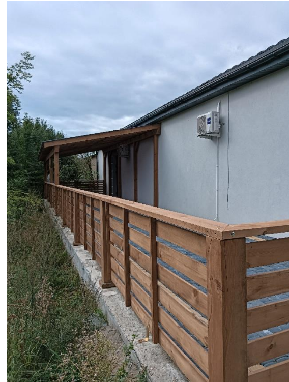
Wykonanie zadaszonego tarasu i balustrady przy świetlicy wiejskiej