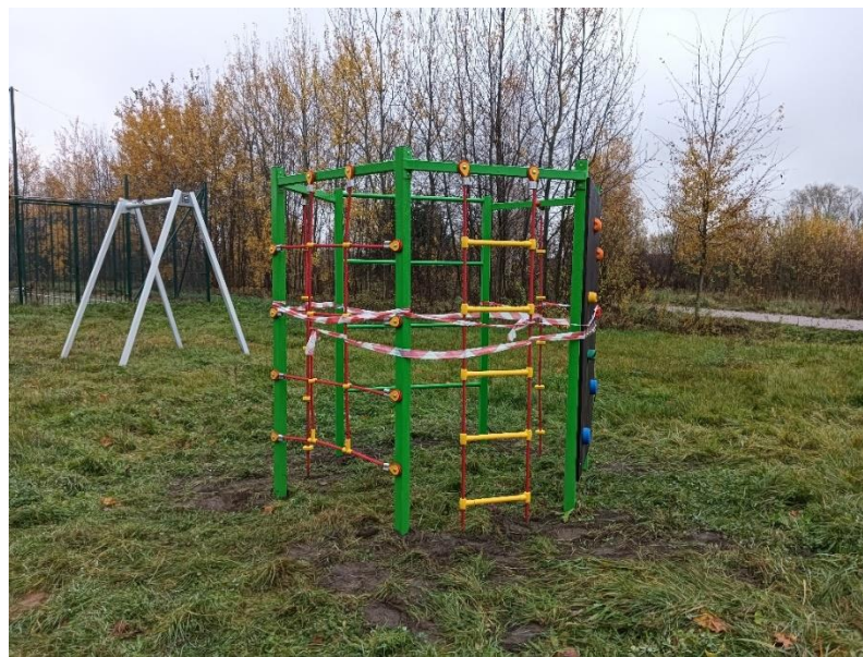
Doposażenie placu zabaw