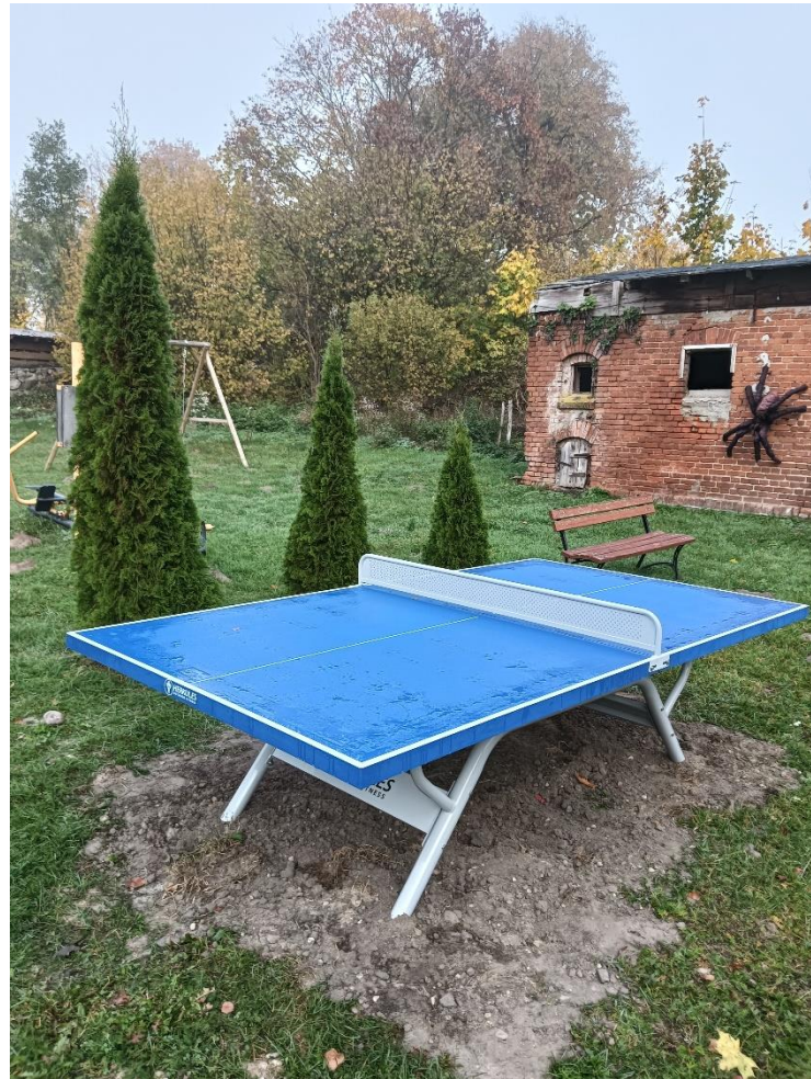
Stół do ping-ponga