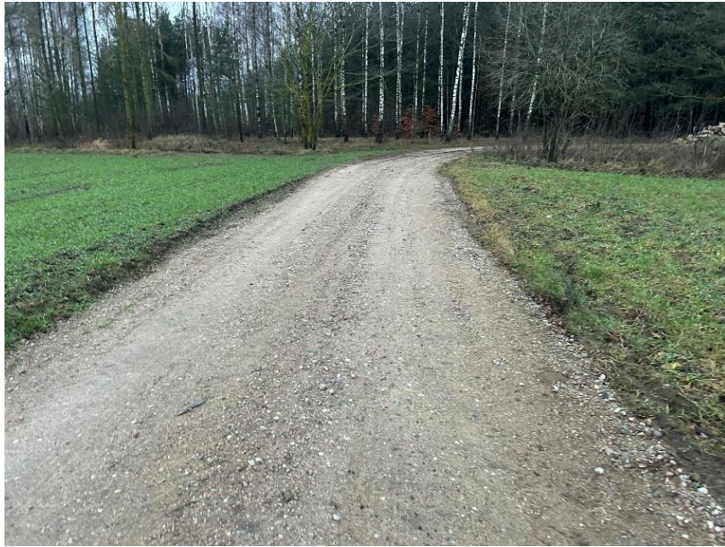
Utwardzenie, wyrównanie drogi