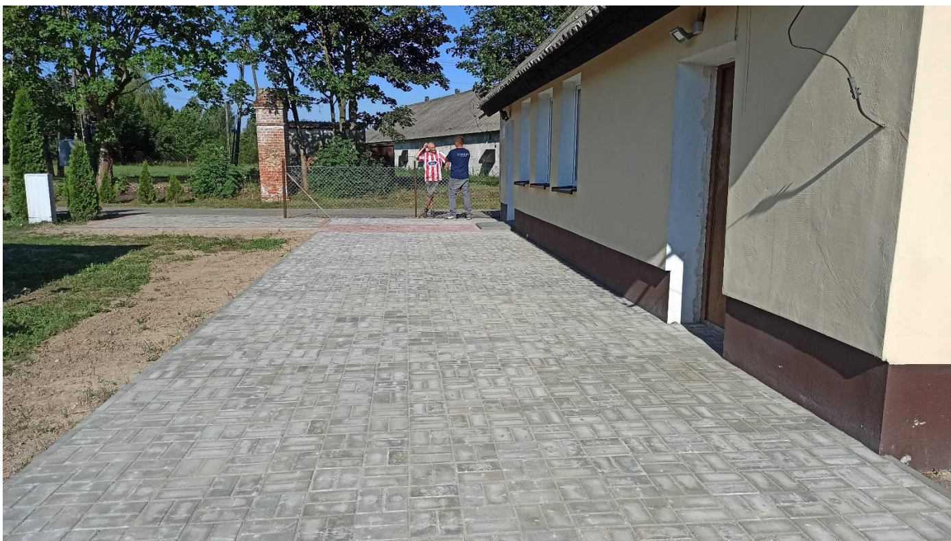
Wyłożenie kostką placu przy świetlicy wiejskiej