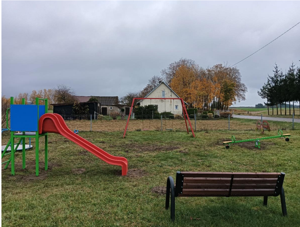
Doposażenie placu zabaw- zjeżdżalnia i huśtawka wagowa