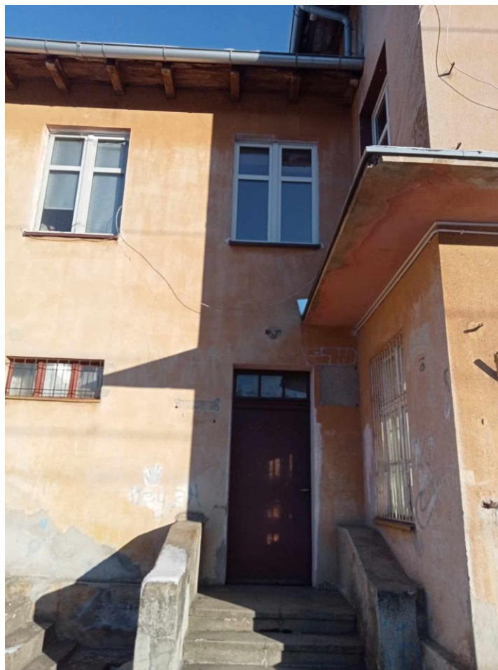
Opłaty za prąd w świetlicy wiejskiej