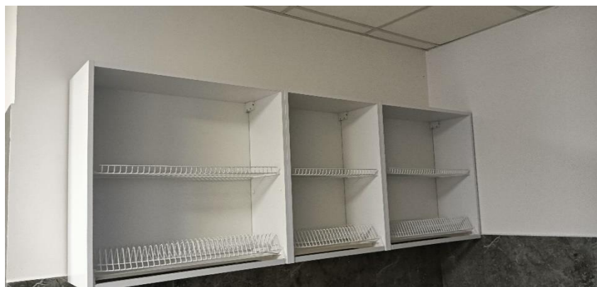
Zakupiono szafki do świetlicy wiejskiej