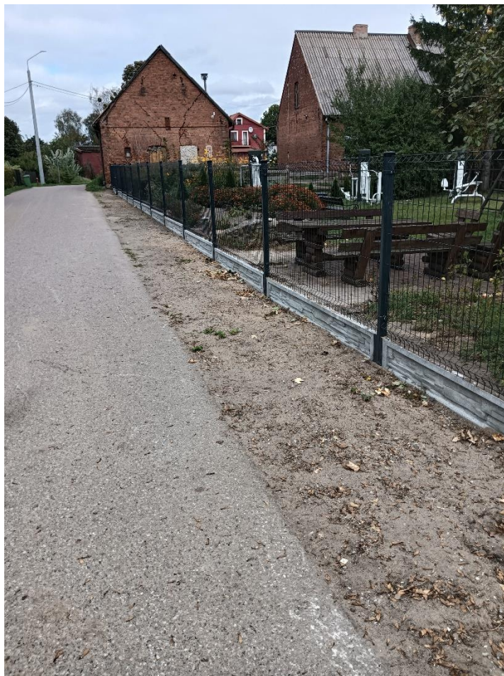
Nowe ogrodzenie przy świetlicy wiejskiej w Jeglii