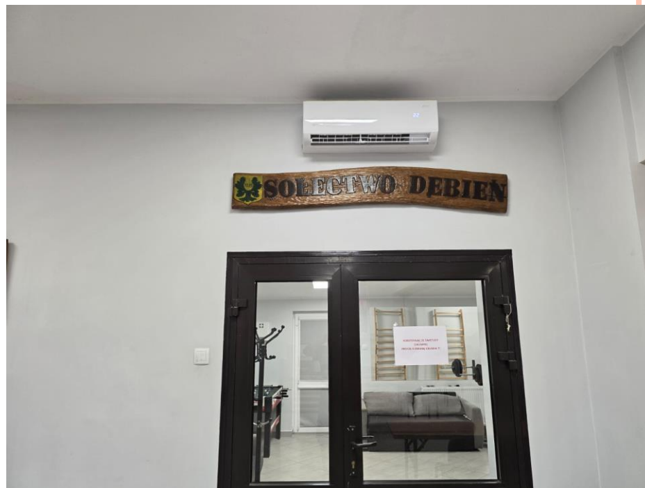
Klimatyzacja w świetlicy wiejskiej