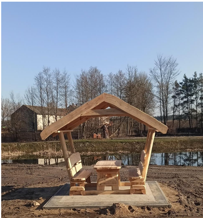
Rekreacyjne zagospodarowanie terenu przy stawie