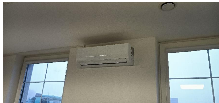
Klimatyzator w świetlicy wiejskiej